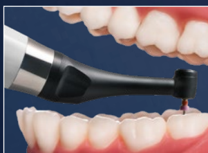
Superkleiner Kopf und schlanker Hals des CanalPro X-Move Winkelstücks