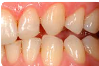
Abb. 17: Die abschliessende Kontrolle der Eckzahnführung zeigt frontale Kontakte bei Laterotrusion erst bei Überstellung des unteren Eckzahnes.