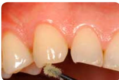
Abb. 5: Die Etablierung einer Hybridschicht sollte durch das einmassieren von ONE COAT 7 UNIVERSAL während 20s aktiv unterstützt werden.