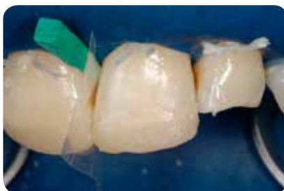
Abb. 11: Da nur eine Farbe verwendet wird, bedarf es keiner aufwändigen Schichtung.