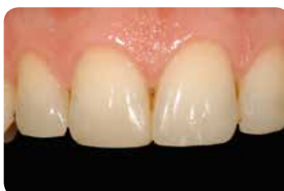
Abb. 20: Die mittleren Incisivi eine Woche postoperativ, die Aufbauten wirken natürlich.