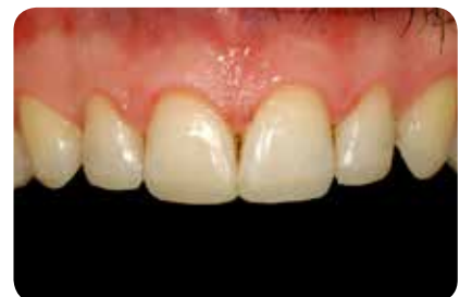
Abb. 18: Abschlusssituation direkt postoperativ. Die Restaurationen erscheinen im Vergleich zur ausgetrockneten Zahnhartsubstanz zu dunkel und zu transluzent.