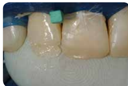
Abb. 12: Um palatinale Überschüsse zu vermeiden, kann der Finger als „Matrize“ eingesetzt werden.