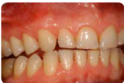
Abb. 7: Die wiederhergestellte Eckzahnführung resultiert in der gewünschten Dissklusion aller restlichen Zähne bei Laterotrusionsbewegung.