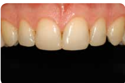
Abb. 19: Eine Woche postoperativ zeigt sich die sehr gute optische Integration der Restaurationen.