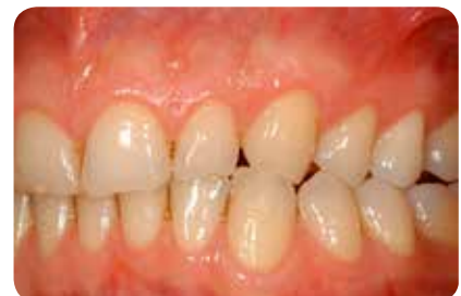
Abb. 3: Auf der linken Seite stellt sich die Situation entsprechend dar.