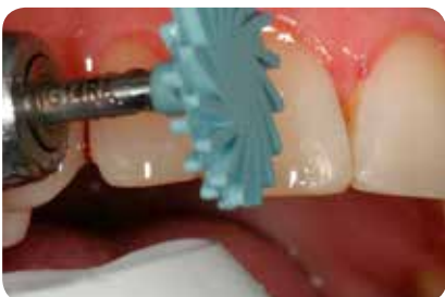
Abb. 16: Die Politur mit DIATECH ShapeGuard Polierern.