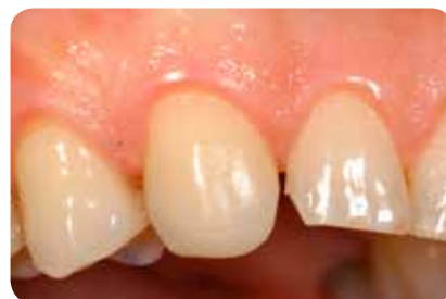
Abb. 6: Zustand nach Aufbau des Eckzahnes mit einer einzigen Schicht BRILLIANT EverGlow A3/D3.