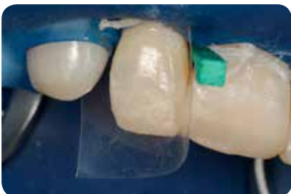
Abb. 13: Für die Schichtung der approximalen Wand wird eine transluzente Matrize gelegt.

Abbildung 18 zeigt den direkt postoperativen Zustand. Deutlich ist der Übergang von den Zähnen zu den Kompositaufbauten zu erkennen. Die Res-