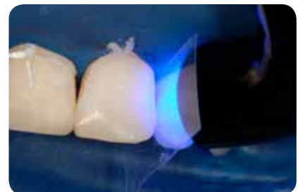
Abb. 15: Die Aushärtung der jeweiligen Schichten erfolgte mit einer S.P.E.C. 3 LED mit 11 mm Lichtleiter bei 1600 mW während je 15 s.