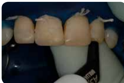
Abb. 14: Für die Restauration wird ausschliesslich die Universalfarbe A3/D3 verwendet.