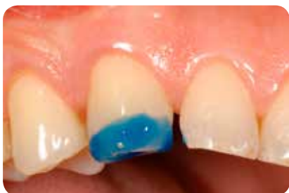
Abb. 4: Selektive Schmelzätzung für 30s mit 35% Phosphorsäure (Etchant Gel S, COLTENE).

Die technisch einfache Korrektur der Eckzähne erfolgt in der Regel unter relativer Trockenlegung, so dass die Eckzahnführung sofort überprüft werden kann. Für den Aufbau der Schneidezähne empfiehlt sich eine absolute Trockenlegung mit Kofferdam, was die Umsetzung der Aufbauten erleichtert und beschleunigt (Abb. 9). Bei Korrekturen der Oberkieferfront muss zur Beurteilung der Inzisallinie grundsätzlich die gesamte Front von Eckzahn zu