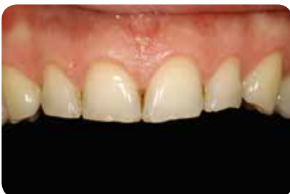
Abb. 1: Ausgangssituation: Abradierte Oberkieferfront mit kleinen Schmelzausbrüchen an den Incisalkanten der Schneidezähne.

Die Farbauswahl erfolgte indem die mit dem Farbschlüssel gewählte Farbe ohne Adhäsivtechnik direkt auf die Schneidekante einer der beiden mittleren Schneidezähne aufgetragen und polymerisiert wurde. In diesem Fall wurde der „Duo Shade“ A3/D3 gewählt. Diese Technik der Farbauswahl ist sehr zuverlässig, da so Farbe und Transluzenz beurteilt werden können. Entscheidend ist dabei allerdings, dass der betreffende Zahn zuvor noch nicht getrocknet wurde, weil dies zu einer Farbänderung des Zahnes führt und der Zahn danach durch erneute Wasseraufnahme nur sehr langsam zu seiner Ausgangsfarbe zurückkehrt. Zudem muss das Komposit für den Farbvergleich unbedingt polymerisiert werden, da sich während der Polymerisation des Komposits durch das Aufbrauchen des Photo-