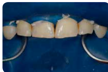
Abb. 9: Bei Aufbauten im Frontzahnbereich sollte die Trockenlegung immer die gesamte Front umfassen.