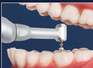
Contrangolo con testina e collo normali