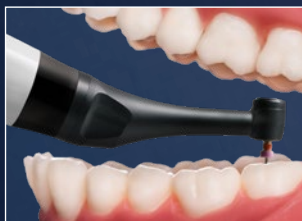
Contrangolo CanalPro X-Move con testina super mini e collo sottile